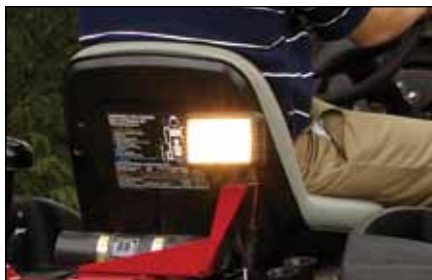
ヘッドライト・キット | 110-1314