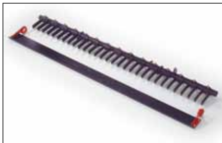
均しブレード | 108-8496