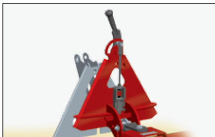
QAS A フレーム・アセンブリ | 108-9427