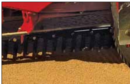
カーバイド・タイン・アセンブリ | 08735