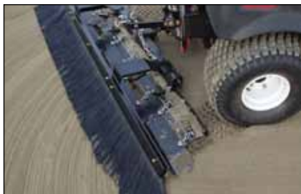
ツース・レーキ・ブルーム | 08816