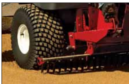
むくタイン・ツールバー | 08734