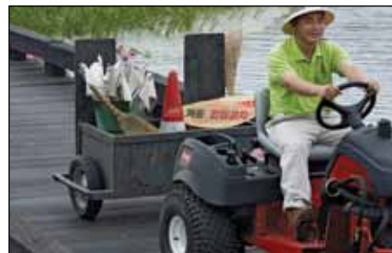
ヒッチと牽引用バー | 110-1375