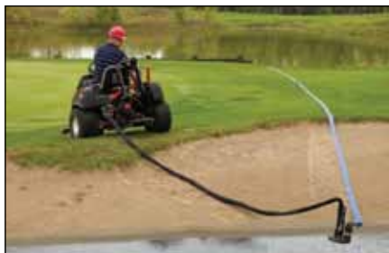
バンカー・ポンプ・リモート・ディスチャージ・キット | 115-2084