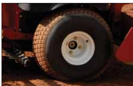
ターフ・タイヤ | 94-6126