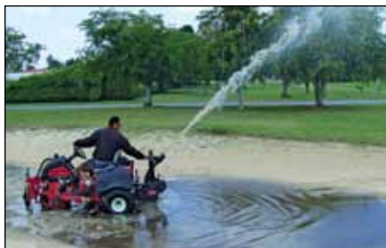
QAS バンカー・ポンプ | 08765