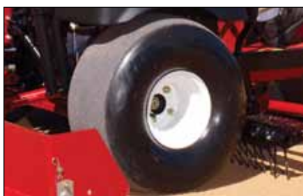
スムーズ・タイヤ | 112-0034