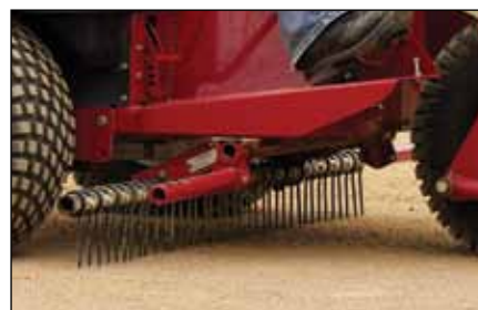
スプリング・タイン・ツールバー | 08733