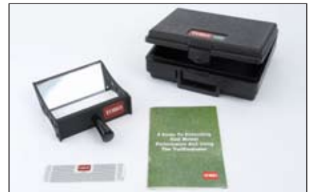
ターフ・エバリュエータ | 04399