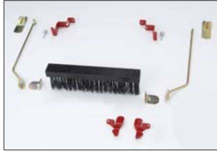
プッシュ型ブラシ | 04119

仕様は変更される場合があります。 詳細は Toro ディストリビュータにおたずねください。 ©2009 The Toro Company 8111 Lyndale Ave. S. Bloomington, MN 55420-1196 Printed in the USA. J 200-4277