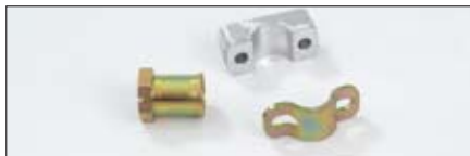
後ローラ調整キット | 114-4630