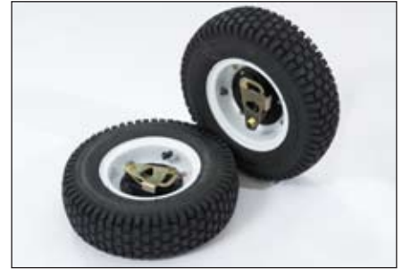
ホイール・キット | 04123