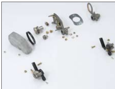
フレックス・グルーマ・ドライブ | 04224