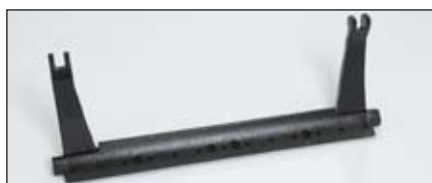
アグレッシブ・ベッドバー | 99-3794-03