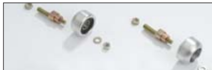
前ローラ延長キット | 108-4333