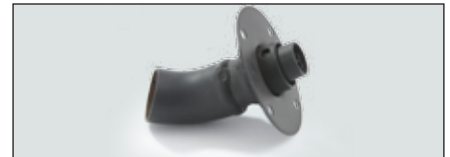
スパーク・アレスタ・キット | 117-1441