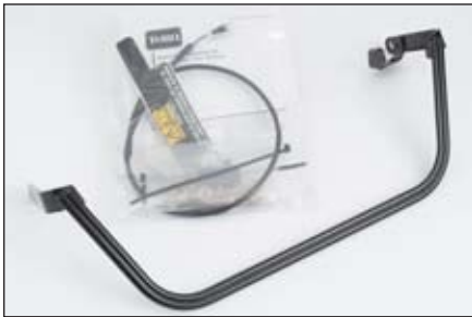
オペレータ・プレゼンス・キット | 112-9282