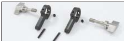
グルーマ・クイックアップ・キット | 107-8101